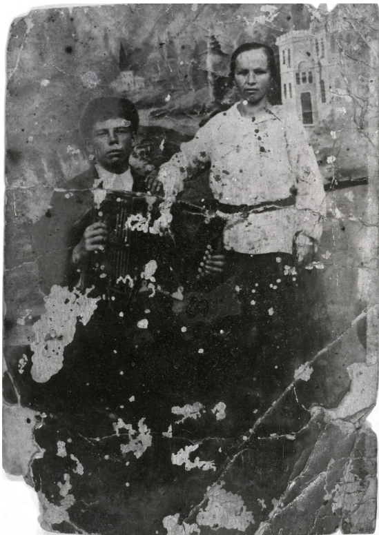
Фото N 3