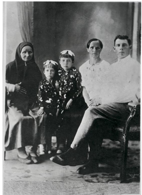
Фото N 4

части выцветшие за давностью лет дорогие семейные реликвии.