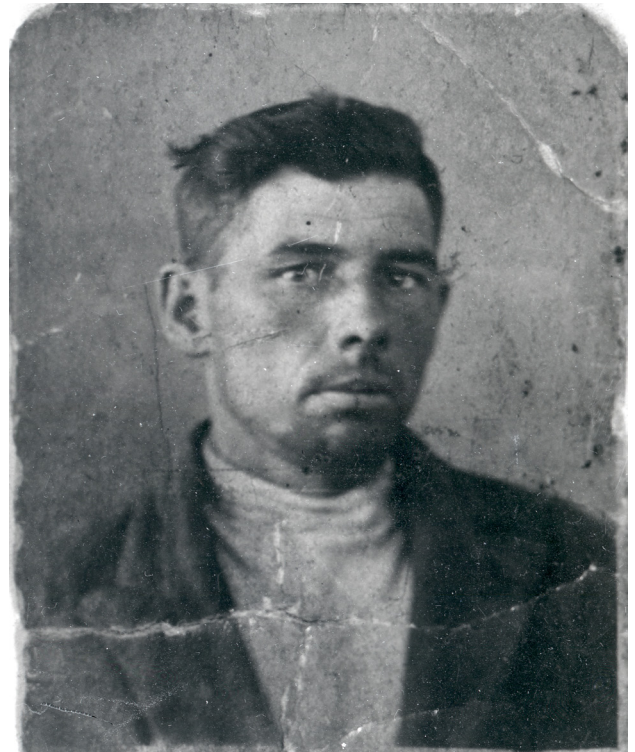
Фото N 2